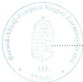
Demeter Ervin kormány megbízott